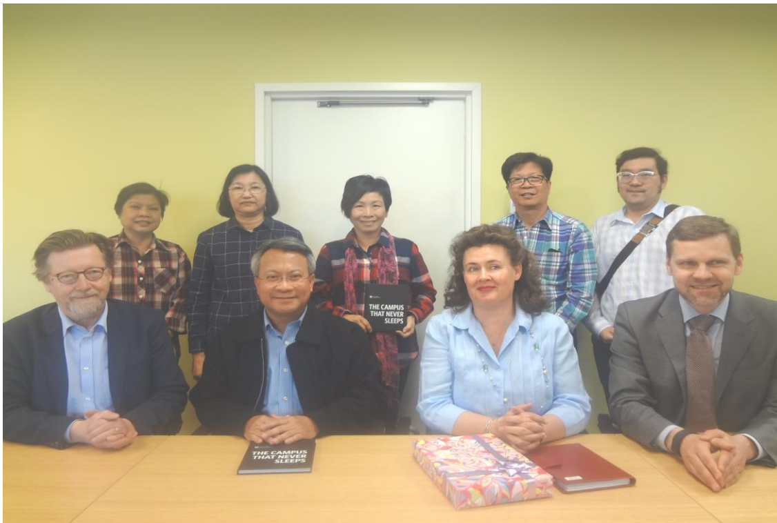
เลขาธิการสภาการศึกษา คณะผู้บริหารและเจ้าหน้าที่ร่วมการประชุมโต๊ะกลมด้านการศึกษาไทย - ฟินแลนด์

ดร.กมล รอดคล้าย เลขาธิการสภาการศึกษา คณะผู้บริหารและข้าราชการสำนักงานเลขาธิการสภาการศึกษา เดินทางเข้าร่วมการประชุมโต๊ะกลมด้านการศึกษาไทย - ฟินแลนด์ ณ สาธารณรัฐฟินแลนด์ ระหว่างวันที่ ๓๐ เมษายน - ๘ พฤษภาคม ๒๕๕๙ การประชุมครั้งนี้มีวัตถุประสงค์เพื่อแลกเปลี่ยนเรียนรู้แนวปฏิบัติที่ดี ในด้านการจัดการศึกษาให้มีคุณภาพและเท่าเทียมกัน ตลอดจนหาหรือความร่วมมือระหว่างกันในประเทศที่ประเทศไทยให้ความสนใจเป็นพิเศษในช่วงของการจัดทำ (ร่าง) แผนการศึกษาแห่งชาติ และ (ร่าง) แผนพัฒนาการศึกษาแห่งชาติ ฉบับที่ ๑๒ อาทิ การผลิตและพัฒนาครูซึ่งประเทศฟินแลนด์มีแนวปฏิบัติที่ดีและได้รับการยกย่องในระดับนานาชาติ หลักสูตรและการจัดการเรียนการสอน การบริหารจัดการศึกษา แนวทางการจัดสรรงบประมาณทางการศึกษา