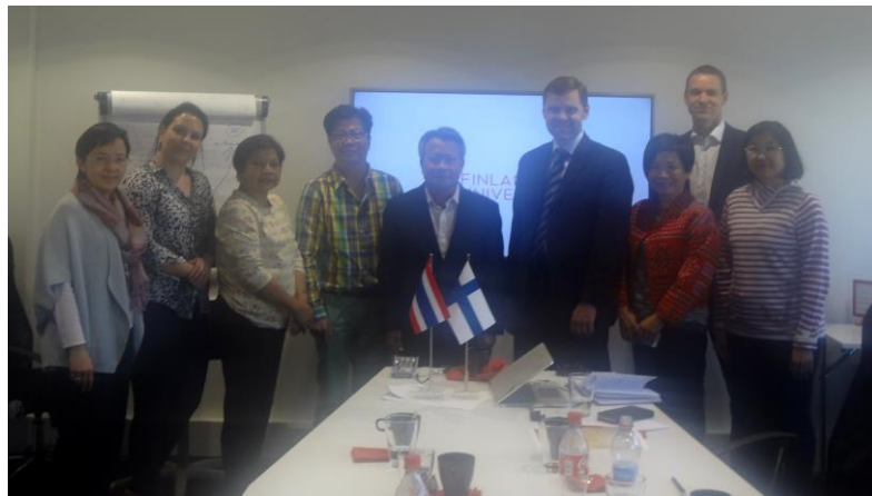
เลขาธิการสภาการศึกษา คณะผู้บริหารและเจ้าหน้าที่ที่ประชุมสรุปผลการประชุมและการสังเกตการณ์ การเรียนการสอนกับ Finland University

โดยประเทศไทยได้แสดงความสนใจที่จะขอความร่วมมือจากประเทศฟินแลนด์ โดยอาจเรียนเชิญ Professor Erno Lehtinen เดินทางมาบรรยายให้คำปรึกษา ใน ๔ ประเด็นหลัก ได้แก่