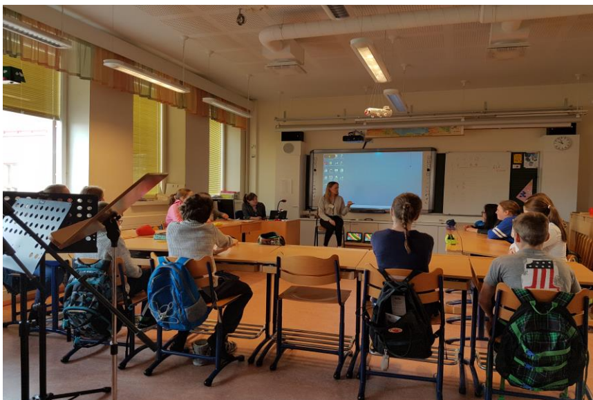
บรรยากาศการฝึกสอนของนักศึกษาครู ณ Rovaniemi Teacher Training School

นอกจากนี้ ยังมีข้อกำหนดพิเศษสำหรับครูการศึกษาพิเศษและครูแนะแนวที่ต้องมีคุณวุฒิระดับปริญญาโท ด้านการศึกษาพิเศษและการแนะแนว สำหรับการฝึกประสบการณ์ในการสอน นักศึกษาครูจะต้องทำการฝึกสอน สลับกันกับการเรียนในภาคทฤษฎีในมหาวิทยาลัยเป็นช่วงๆ โดยการฝึกสอนจะมีสามช่วงคือ ปี ๑ ปี ๓ และปีสุดท้าย เพื่อสั่งสมประสบการณ์ในการสอนอย่างเข้มข้น โดยในกระบวนการฝึกสอนจะมีครูประจำ ที่สอนในรายวิชานั้นๆ ทำหน้าที่เป็นพี่เลี้ยง (Mentor) คอยชี้แนะและประเมินการฝึกประสบการณ์ เพื่อปรับปรุงการจัดการเรียนการสอนและมีเพื่อนนักศึกษาจำนวน 1 คน สังเกตการณ์การฝึกประสบการณ์ใน ชั้นเรียนด้วย