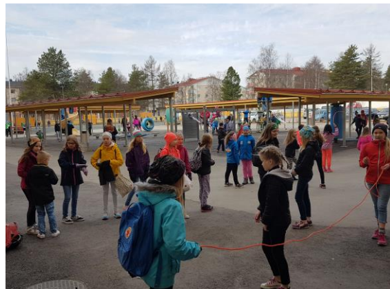
บรรยากาศการเรียนการสอนใน Rovaniemi Teacher Training School

สำหรับจำนวนนักเรียนต่อห้องสูงสุดไม่เกิน ๒๐ คน เนื่องจากให้ความสำคัญกับการพัฒนาความสามารถในการเรียนรู้และการดำรงชีวิตตามศักยภาพของนักเรียนแต่ละคนซึ่งมีความแตกต่างกัน โรงเรียนให้ความสำคัญกับการดูแลเด็กรายบุคคล ไม่เน้นการแข่งขัน และไม่มีการให้เกรด ไม่มีการใช้ข้อสอบมาตรฐานในการวัดผลนักเรียน