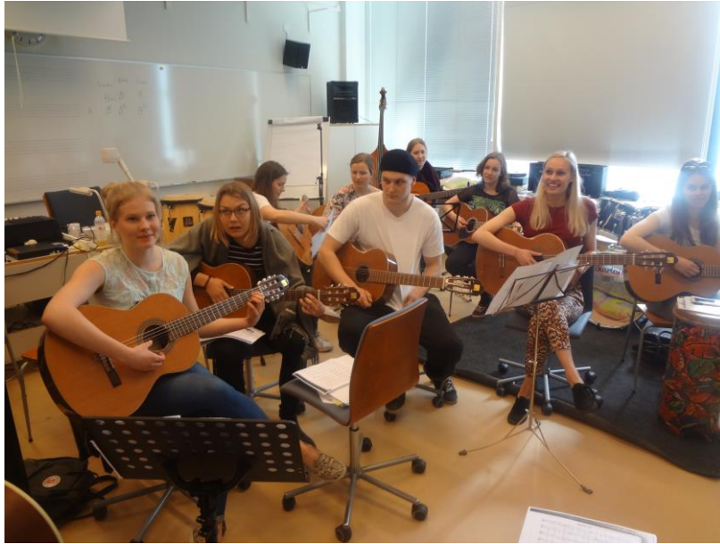
บรรยากาศการเรียนการสอนวิชาดนตรี คณะครุศาสตร์ The University of Turku

ของมหาวิทยาลัยต่างๆ ที่มีอยู่ ๑๐ แห่งทั่วประเทศ ส่วนครูประจำวิชา (Subject Teacher) ต้องศึกษาในสาขานั้นๆ เป็นเวลา 4 ปี ในคณะต่างๆ จากนั้นจึงมาศึกษาเพิ่มเติมด้านวิชาครูและศาสตร์การสอน (Pedagogy) อีก ๑ ปี ซึ่งเมื่อจบการศึกษาแล้วจะได้รับปริญญาโทก่อนออกไปเป็นครูในสถาบันการศึกษาต่างๆ