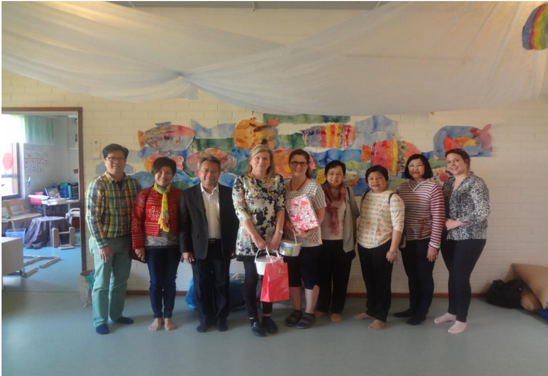
การสังเกตการณ์ Daycare Centre

นอกจากนี้ คณะจากสำนักงานเลขาธิการสภาการศึกษายังได้เดินทางไปสังเกตการณ์การจัดการของ Daycare Centre ของกรุงเฮลซิงกิ ซึ่งเปิดรับเด็กเล็กที่พักอาศัยในพื้นที่รอบๆ ศูนย์ที่มีอายุตั้งแต่ ๑ – ๕ ขวบ แม้จะมี Daycare Centre แต่ฟินแลนด์เน้นให้เด็กมีเวลาใกล้ชิดกับครอบครัวให้มากที่สุด เพราะเชื่อว่าครอบครัวสามารถให้ทั้งความรู้และความรัก ความเข้าใจในวัฒนธรรมและประเพณีที่ดึงมาให้เด็กได้ดีกว่าโรงเรียนอนุบาล