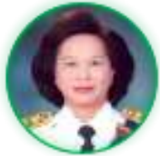
ศาสตราจารย์กิตติคุณ ชนิตา รักษ์พลเมือง