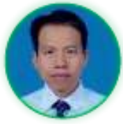
ศาสตราจารย์อำนาจ วงศ์บัณฑิต (๙ เม.ย. ๖๒ - ปัจจุบัน)