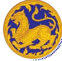
ปลัดกระทรวงมหาดไทย