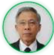
พลเอก พล ส่างเนตร