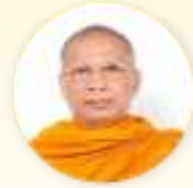
สมเด็จพระมหาธีรราชเจ้า (สุขัน อคฺคฺชโณ)