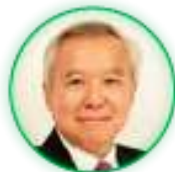
ศาสตราจารย์ดิเรก ปัทมสิริวัฒน์ (๒๖ ก.พ. ๖๒ - ปัจจุบัน)