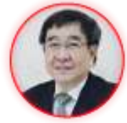
รองศาสตราจารย์บัณฑิต กีพากกร (๑๒ ก.ย. ๖๐ - ๒๘ ม.ค. ๖๒)