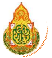
เลขาธิการคณะกรรมการ การศึกษาขั้นพื้นฐาน