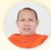
พระเทพเวที (พ.อ. อาภาทโร)