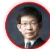
นายกอบศักดิ์ ภูตระกูล (๑๒ ก.ย. ๖๐ - ๑๖ พ.ย. ๖๐)