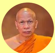
สมเด็จพระมหาธีรราชเจ้า (สุชิน อคฺคชิโน)