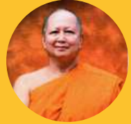
พระพรหมบัณฑิต ประยูร ธมฺมจิตฺโต