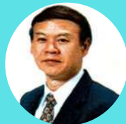
ศ.นพ.อภิชาติ จิตต์เจริญ