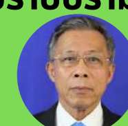
พลเอก พลา สง่าเนตร

ด้านส่งเสริมการป้องกัน และการปราบปรามการทุจริต