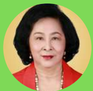
ศ.กิตติคุณชนิดา รักษ์พลเมือง

ด้านมาตรฐานและการประกันคุณภาพการศึกษา และการวัด และประเมินผลการศึกษา