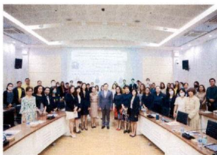
ประชุมเชิงปฏิบัติการระดับการประเมินคุณธรรมและความโปร่งใสในการดำเนินงานของหน่วยงานภาครัฐ เมื่อวันที่ ๒๒ มกราคม ๒๕๖๗