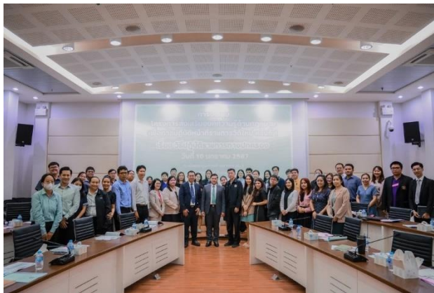
๑.๖.๓ ครั้งที่ ๒ เรื่อง จิตสำนึกในการมีวินัยและการรักษาวินัยของข้าราชการพลเรือนสามัญ เมื่อวันที่ ๑๓ กุมภาพันธ์ ๒๕๖๗