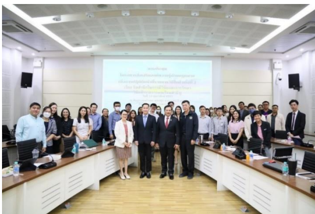
๑.๖.๔ ครั้งที่ ๓ เรื่อง การปฏิบัติหน้าที่ราชการให้ถูกต้องและมีประสิทธิภาพ เมื่อวันที่ ๑๕ มีนาคม ๒๕๖๗