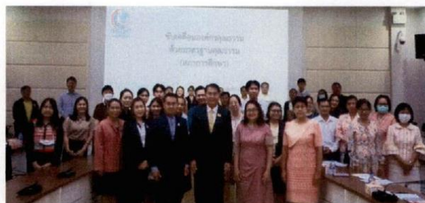
ประชุมเชิงปฏิบัติการโครงการส่งเสริมมาตรฐานการขับเคลื่อนองค์กรคุณธรรมภาครัฐ พ.ศ. ๒๕๖๗ เมื่อวันที่ ๒๘ มีนาคม ๒๕๖๗