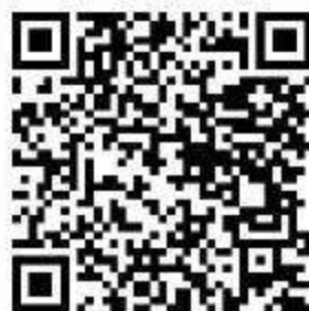
แผนขับเคลื่อนกรอบคุณวุฒิแห่งชาติสู่การปฏิบัติ พ.ศ. 2562 - 2565