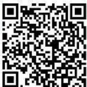
กรอบคุณวุฒิแห่งชาติ พ.ศ. 2560