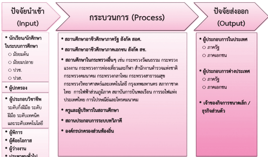
ภาพที่ ๑ : กลุ่มเป้าหมายด้านอาชีวศึกษา

ดังนั้น กลุ่มเป้าหมายของการพัฒนาอาชีวศึกษาในการปฏิรูปการศึกษาในทศวรรษที่สอง จึงมีได้หมายความถึง ผู้เรียน ผู้ปกครอง ผู้สอน และผู้กำกับนโยบายในสถานศึกษาของอาชีวศึกษาเท่านั้น แต่หมายรวมถึงสถานศึกษาอื่นๆ ซึ่งผลิตกำลังคนด้านอาชีวศึกษา ผู้ประกอบการในตลาดแรงงาน กลุ่มผู้ประกอบการซึ่งเป็นกำลังคนระดับฝีมือ ระดับเทคนิค และระดับเทคโนโลยี สามารถแสดงให้เห็นได้ ดังภาพต่อไปนี้