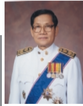
ดร.สุวัฒน์ เงินจ๋า

ที่ปรึกษาสำนักงานเลขาธิการ สภาการศึกษา อดีตรองกรรมการและเลขาธิการ สำนักงานปฏิรูปการศึกษา