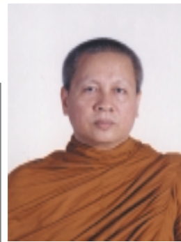
พระราชเมธาภรณ์ (แสวง ธมฺมเมสโก)

อธิการบดีมหาวิทยาลัย มหาจุฬาลงกรณราชวิทยาลัย