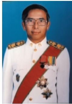
ยูกาชาต และเนตรนารี