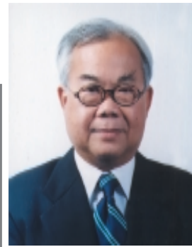
ศาสตราจารย์ ดร.ชัยอนันต์ สมุทวณิช