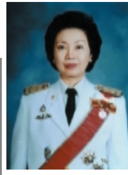
ดร.คุณหญิงกษมา วรวรรณ ณ อยุธยา