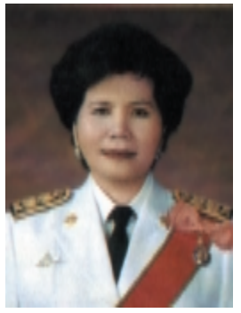
คุณหญิงทิพาวดี เมฆสวรรค์

2.3 ปลัดกระทรวงเทคโนโลยี สารสนเทศและการสื่อสาร