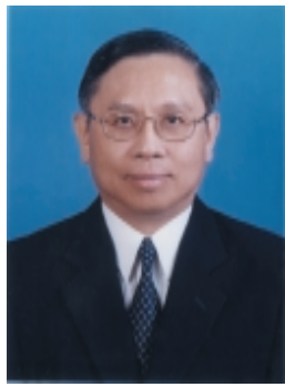
ดร.วิทยา มานะวาณิชเจริญ

อธิการบดีมหาวิทยาลัยเทคโนโลยี พระจอมเกล้าธนบุรี อดีตรองผู้อำนวยการศูนย์เทคโนโลยี