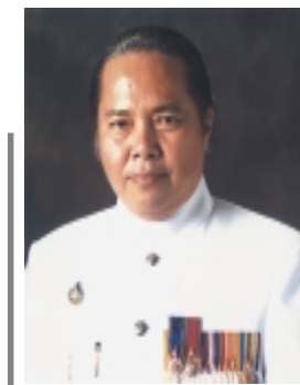
พระราชครูวามเทพมุนี