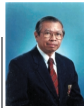
รองศาสตราจารย์ ดร.ชนะ กสิภรณ์

สมาชิกสภาที่ปรึกษา เศรษฐกิจและสังคมแห่งชาติ อดีตอธิการบดีสถาบันเทคโนโลยี พระจอมเกล้าพระนครเหนือ