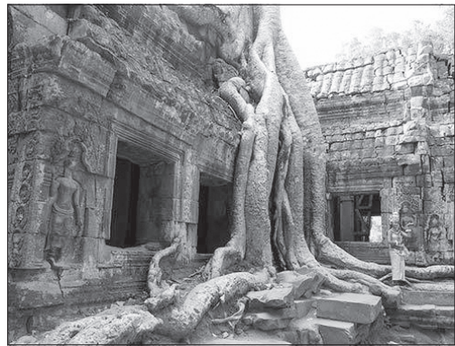
ปราสาทตาพรหม

มารดาเป็นวัดในพุทธศาสนาที่มีขนาดใหญ่โตมากกว่าสนามหลวงของไทย ตั้งอยู่กลางป่าและมีแมงไม้ปกคลุม ปราสาทหลังนี้มีรากไม้ขนาดมหึมาขึ้นปกคลุมหลังคาปราสาทหลายแห่ง ต้นไม้ใหญ่ที่ซ่อนไขไปตามแผ่นดินมีอยู่ 2 พันธุ์ คือ ต้นสะปงหรือต้นสำโรง และต้นสระเลาเป็นไม้ยืนต้น ซึ่งเป็นจุดสนใจที่นักท่องเที่ยวใฝ่ฝันอยากมาบันทึกภาพเก็บไว้ และยังคงเคยเป็นสถานที่ถ่ายทำภาพยนตร์เรื่อง Tomb Rider อีกด้วย