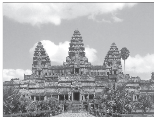
ปราสาทนครวัด

นอกจากนี้ยังเป็นปราสาทที่หันหน้าไปทางทิศตะวันตก ซึ่งถือว่าเป็นทิศของคนตาย นักปราชญ์ตะวันตกจึงสันนิษฐานว่า การสร้างปราสาทนี้คงสร้างอุทิศแก่ผู้ที่ตายแล้ว และยังคงเป็นที่เก็บพระบรมศพของพระเจ้าสุริยวรมันที่ 2 ตาม