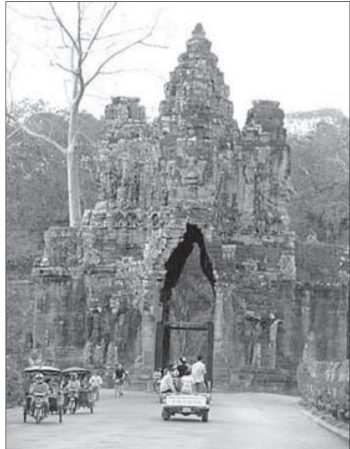
ปราสาทพนมบาเค็ง

ปัจจุบันปราสาทพนมบาเค็งอยู่ในสภาพทรุดโทรมลงมาก พบภาพสลักเพียงไม่กี่แห่ง เช่น ภาพนางอัปสรที่มีเอกลักษณ์เฉพาะตัว แตกต่างจากศิลปะยุคอื่นๆ ตรงรายละเอียดของผ้าถุงที่มี