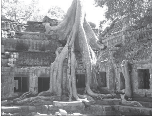
ปราสาทพระขรรค์

บิดาของพระองค์ มีกำแพงล้อมรอบพื้นที่รูปสี่เหลี่ยมผืนผ้าขนาด 700-800 เมตร มีประตูทางเข้าที่มีรูปสลักเทวดาและอสูรยุดนาอยู่สองข้างทางคล้ายกับที่นครธม ที่เป็นเช่นนี้ก็เพราะปราสาทแห่งนี้เคยเป็นที่ประทับของพระเจ้าชัยวรมันที่ 7 มาก่อนสร้างเมืองนครธม ภายในปราสาทประธานมีเจดีย์ศิลาบรรจุพระบรมอัฐิของพระเจ้าธรณินทรวรมันที่ 2 พระราชบิดาของพระองค์ นอกตัวปราสาทมีฐานสูงซึ่งเคยบรรจุพระแสงขรรค์ชัยศรี จึงเรียกว่า "ปราสาทพระขรรค์" ปัจจุบันเก็บรักษาอยู่ที่พระราชวังหลวงกรุงพนมเปญ (ม.จ.สุภัทรดิศกุล (2546, หน้า 106)