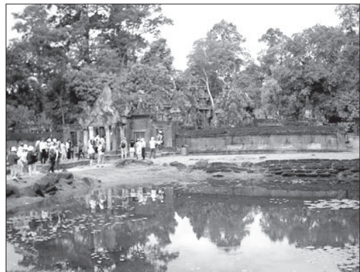
ปราสาทบันทายศรี

ปราสาทบันทายศรี เป็นปราสาทที่ถือว่างดงามที่สุดในประเทศกัมพูชา มีความกลมกลืนสมบูรณ์ เป็นปราสาทแห่งเดียวที่สร้างเสร็จมากกว่า 1,000 ปี แต่ลวดลายยังมีความคมชัดเหมือนสร้างเสร็จใหม่ๆ ปราสาทบันทายศรี สร้างใน พ.ศ.1510