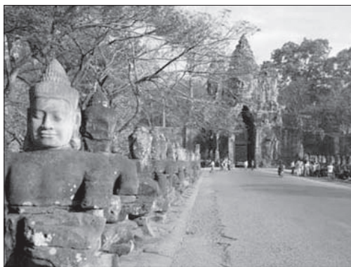
ปราสาทบายน

ประกอบไปด้วย ศาสนสถานหลายหลังเป็นสิ่งสำคัญ ปราสาทเหล่านี้สร้างอยู่บนฐานสูงล้อมรอบด้วยระเบียง 2 ชั้น และบนผนังระเบียงจะมีภาพสลักประกอบโดยรอบ (สยาม เล้าเจริญ, 2547, หน้า 49) ปราสาทบายนนี้ เป็นศูนย์กลางของอังกอร์ธรรมหรือนครธรรม เป็นสุดยอดของปราสาทเขมรในยุคเสื่อมคือ ในรัชกาลของพระเจ้าชัยวรมันที่ 7 ยอดปราสาทขนาดยักษ์ ทุกหลังจะแกะเป็นเทพพักตร์ 4 หน้าหันออกไปทอดพระเนตรความเป็นไปและทุกซ