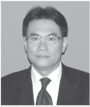
นายจूरินทร์ ลักษณะวิศิษฏ์ รัฐมนตรีว่าการกระทรวงศึกษาธิการ

พระบาทสมเด็จพระปรมินทรมหาภูมิพลอดุลยเดช มีพระบรมราชโองการโปรดเกล้าฯ แต่งตั้งรัฐมนตรีเพื่อบริหารราชการแผ่นดิน โดยมีนายจурินทร์ ลักษณะวิศิษฏ์ เป็นรัฐมนตรีว่าการกระทรวงศึกษาธิการ คนที่ ๕๒ นายชัยวุฒิ บรรณวัฒน์ และนางสาวนริศรา ชวาลตันพิพัทธ์ เป็นรัฐมนตรีช่วยว่าการกระทรวงศึกษาธิการ