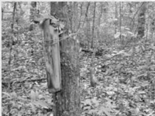
ทำขวัญเด็กกับต้นไม้

นอกจากนี้วิถีชีวิตวัฒนธรรมความเชื่อของชาวปกากะญอเองก็นับเป็นส่วนหนึ่งที่ใช้เป็นกุศโลบายในการรักษาป่า เช่น ชาวปกากะญอมีความเชื่อในโลกนี้มีวิญญาณอยู่ 37 ขวัญ อยู่ในตัวคนเรา 5 ขวัญ คือ ที่กระหม่อม แขนซ้าย แขนขวา ขาซ้าย ขาขวา และอยู่กับสัตว์อีก 32 ขวัญ เช่น อยู่ในปู ปลา หอย กุ้ง กระตัง นก กระรอก ช้าง ม้า เป็นต้น ดังนั้น