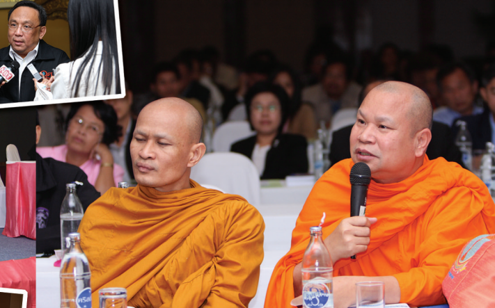
สำนักงานเลขาธิการสภาการศึกษา จัดระดมความคิดเห็น "ปฏิรูปประเทศไทย เริ่มด้วยร่วมใจปฏิรูปการศึกษา" ใน 3 ภูมิภาค คือ ภาคเหนือ ที่ จ.เชียงใหม่ ภาคอีสาน ที่ จ.ขอนแก่น และภาคใต้ ที่ จ.สงขลา ระหว่างเดือนกุมภาพันธ์ - มีนาคม 2552