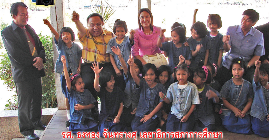
รศ. ธงทอง จันทรางศุ เลขาธิการสภาการศึกษา

เยี่ยมชมการจัดการศึกษาระดับต้นออกเฉียงเหนือ ระหว่างวันที่ 18-20 กุมภาพันธ์ 2552