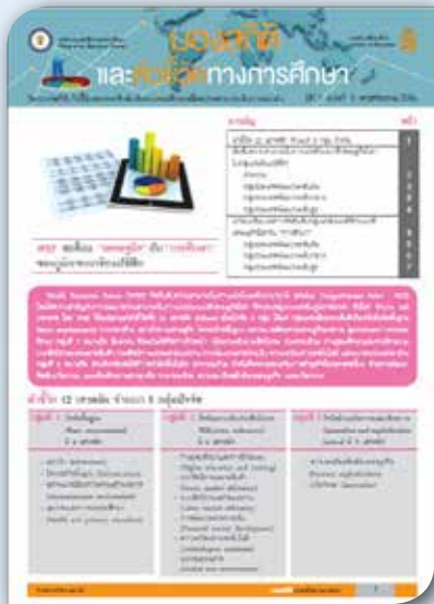
ปีที่ ๑ ฉบับที่ ๓ เดือนพฤศจิกายน ๒๕๕๖ WEF สะท้อน “เศรษฐกิจ” กับ “การศึกษา” ของภูมิภาคเอเชียแปซิฟิก นำเสนอตัวชี้วัด WEF 2013 ด้านการศึกษา เปรียบเทียบใน ภูมิภาคเอเชียแปซิฟิก ๒๐ ประเทศ