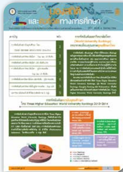
ปีที่ ๑ ฉบับที่ ๖ เดือนธันวาคม ๒๕๕๖ การจัดอันดับมหาวิทยาลัยโลก (World University Rankings) กระจกสะท้อนคุณภาพอุดมศึกษาไทย นำเสนอการจัดอันดับสถาบันอุดมศึกษานานาชาติ โดย Times Higher Education World University Rankings 2013 ในระดับโลก และภูมิภาคเอเชีย