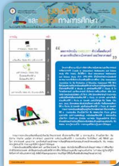
ปีที่ ๑ ฉบับที่ ๔ เดือนพฤศจิกายน ๒๕๕๖ ผลการประเมิน TIMSS 2011 ตัวบ่งชี้ผลสัมฤทธิ์ ทางการเรียนวิชาคณิตศาสตร์ และวิทยาศาสตร์ เปรียบเทียบวิชาคณิตและวิทยาศาสตร์ ชั้น ป.๔ และ ม.๒ ระดับ นานาชาติ และระดับประเทศ รายสังกัดและอนุภูมิภาค