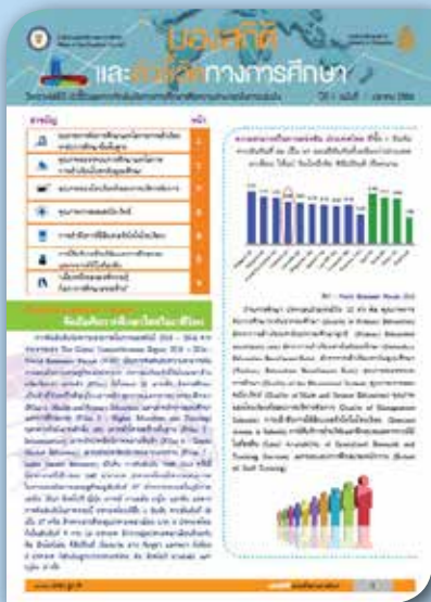
ปีที่ ๑ ฉบับที่ ๑ เดือนตุลาคม ๒๕๕๖ World Economic Forum : จัดอันดับการศึกษาไทยในเวทีโลก นำเสนอตัวชี้วัด WEF 2013 ด้านการศึกษา ๑๐ ตัว เปรียบเทียบในกลุ่ม ASEAN+3

วารสารมองสถิติและตัวชี้วัดทางการศึกษามีเนื้อหาสาระที่เป็นประเด็นเด่น ข้อมูลทันสมัย สืบค้นจากเอกสารและเว็บไซต์ที่กำลังเป็นที่สนใจ จัดทำและเผยแพร่เดือนละ ๒ ฉบับ คัดสรรนำเสนอไปแล้วใน ๔ เดือนแรก ตั้งแต่เดือนตุลาคม ๒๕๕๖ ถึง มกราคม ๒๕๕๗ จำนวน ๘ ฉบับ ดังนี้