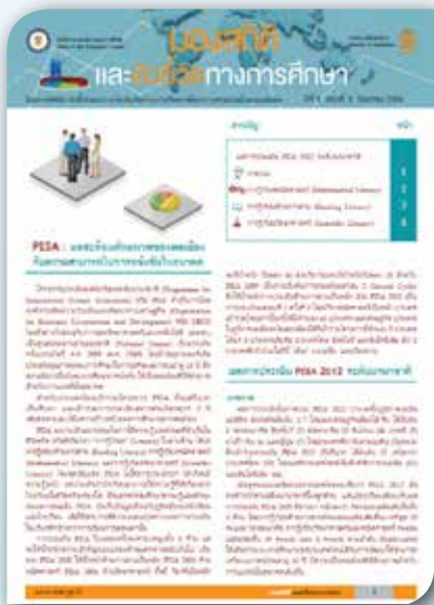
ปีที่ ๑ ฉบับที่ ๕ เดือนธันวาคม ๒๕๕๖ PISA : ผลสะท้อนศักยภาพของพลเมืองกับ ความสามารถในการแข่งขันในอนาคต นำเสนอผลประเมิน PISA 2012 เรื่อง “การรู้เรื่อง” (Literacy) ในสามด้าน ได้แก่ การรู้เรื่องด้านการอ่าน (Reading Literacy) การรู้เรื่องคณิตศาสตร์ (Mathematical Literacy) และการรู้เรื่องวิทยาศาสตร์ (Scientific Literacy)