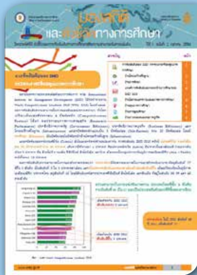
ปีที่ ๑ ฉบับที่ ๒ เดือนตุลาคม ๒๕๕๖ การจัดอันดับของ IMD : กระแจกเงาสะท้อนคุณภาพการศึกษา นำเสนอตัวชี้วัด IMD 2013 ด้านการศึกษา ๑๖ ตัว เปรียบเทียบประเทศในภูมิภาคเอเชียแปซิฟิก ๑๓ ประเทศ