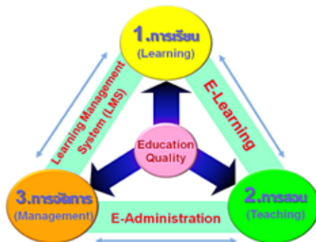
รูปแบบคุณภาพการศึกษา

๒.๓ รูปแบบคุณภาพการศึกษา คุณภาพการศึกษาจะมีองค์ประกอบสำคัญ ๓ ประการ ได้แก่ การเรียน การสอน และการจัดการ ซึ่งมีความเชื่อมโยงกัน และด้วยนวัตกรรมและเทคโนโลยีทางการศึกษา และคำนึงถึงระดับและประเภทการศึกษา เช่น การศึกษาปฐมวัย การศึกษาขั้นพื้นฐาน การศึกษาอุดมศึกษา การเรียนรู้ของผู้ใหญ่ การศึกษาอาชีวศึกษา เป็นต้น ดังแผนภาพต่อไปนี้