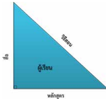
รูปแบบคุณภาพผู้เรียน

๒.๒ รูปแบบคุณภาพผู้เรียน การเรียนรู้ของผู้เรียนขึ้นอยู่กับคุณภาพของครูผู้สอน ซึ่งต้องเข้าใจหลักสูตรและต้องเป็นหลักสูตรที่เหมาะสมกับการพัฒนาศักยภาพของผู้เรียนด้วย การใช้สื่อที่เหมาะสมกับยุคสมัยและบทเรียน รวมทั้งความสนใจของผู้เรียน และที่สำคัญที่สุดคือ เทคนิควิธีสอนที่เป็นนวัตกรรมร่วมสมัยและเหมาะสมกับบริบททางสังคมและพื้นฐานของผู้เรียน ครูที่เก่งเนื้อหาแต่ถ้ามีเทคนิควิธีสอนที่ไม่เหมาะสม ก็จะไม่สามารถพัฒนาคุณภาพของผู้เรียนได้