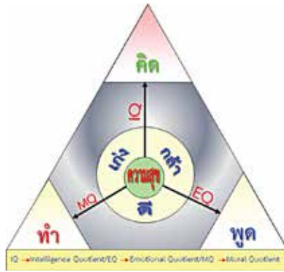
รูปแบบคุณภาพ

๒.๒ รูปแบบคุณภาพผู้เรียน การเรียนรู้ของผู้เรียนขึ้นอยู่กับคุณภาพของครูผู้สอน ซึ่งต้องเข้าใจหลักสูตรและต้องเป็นหลักสูตรที่เหมาะสมกับการพัฒนาศักยภาพของผู้เรียนด้วย การใช้สื่อที่เหมาะสมกับยุคสมัยและบทเรียน รวมทั้งความสนใจของผู้เรียน และที่สำคัญที่สุดคือ เทคนิควิธีสอนที่เป็นนวัตกรรมร่วมสมัยและเหมาะสมกับบริบททางสังคมและพื้นฐานของผู้เรียน ครูที่เก่งเนื้อหาแต่ถ้ามีเทคนิควิธีสอนที่ไม่เหมาะสม ก็จะไม่สามารถพัฒนาคุณภาพของผู้เรียนได้