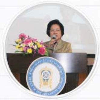
รองเลขาธิการสภาการศึกษา

กล่าวว่าจากนโยบายด้านการศึกษาของรัฐบาลได้ให้ความสำคัญกับการพัฒนาการศึกษาของประเทศใน ๗ ประเด็นหลัก คือ ๑.) เร่งพัฒนาคุณภาพการศึกษาโดยการปฏิรูประบบความรู้ในสังคมไทย ๒.) สร้างและกระจายโอกาสทางการศึกษา ๓.) ปฏิรูปครูโดยยกฐานะครูให้เป็นวิชาชีพชั้นสูง ๔.) จัดการศึกษาขั้นอุดมศึกษาและอาชีวศึกษาให้สอดคล้องกับตลาดแรงงาน ๕.) พัฒนาการใช้เทคโนโลยีสารสนเทศเพื่อการศึกษา ๖.) สนับสนุนการวิจัยและพัฒนาเพื่อสร้างทุนปัญญาของชาติ และ ๗.) เพิ่มขีดความสามารถของทรัพยากรมนุษย์เพื่อรองรับการเปิดเสรีประชาคมอาเซียนการวิจัยจึงถือเป็นกลไกหลักในการพัฒนาทรัพยากรมนุษย์นำไปสู่การสร้างทุนทางปัญญาของชาติ