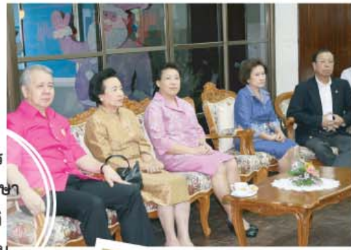
กรรมการสภาการศึกษาให้เกียรติมาร่วมงาน