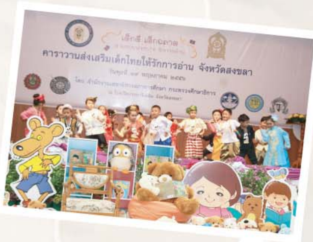
นำรักสดใสกับการแสดงชุด "เด็กปฐมวัย...ก้าวไกลสู่อาเซียน"