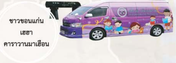
ชาวขอนแก่นเฮฮา คาราวานมาเยือน