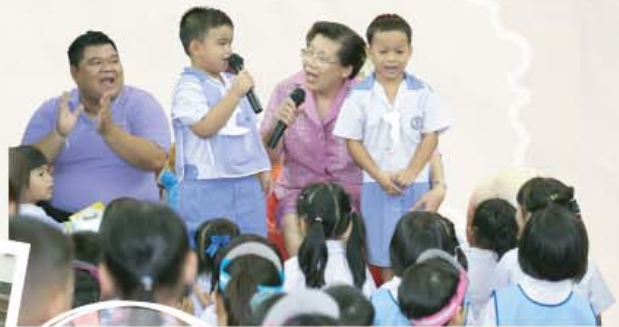
หนู ๆ ม่วนซื่น ฟังนิทานสนุก แล้วยังได้นิทานกลับไปอ่านที่บ้านด้วยจ้า