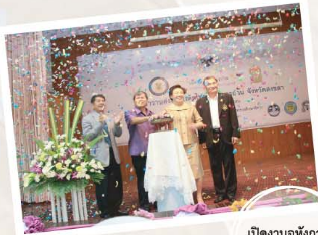
เปิดงานอหังการ คาราวานสงขลา