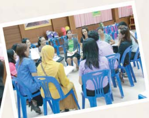
ร่วมเสวนาระดมความคิดกันในกลุ่มของครู ผู้ปกครอง เรื่อง "การเลี้ยงดูเด็กปฐมวัย"