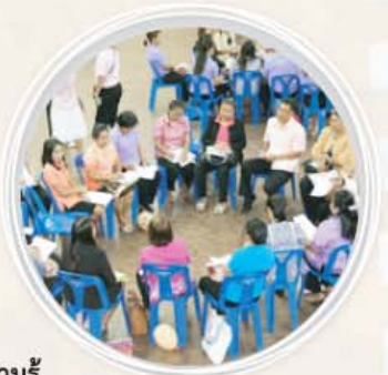
พ่อแม่ คุณครู ปลื้มใจได้ความรู้ และยังได้แลกเปลี่ยนวิธีทำให้หนู ๆ เป็นเด็กฉลาด