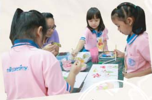
เด็ก ๆ สนุกสนาน กับกิจกรรมที่คิดสรร แล้วในซุ่มต่าง ๆ