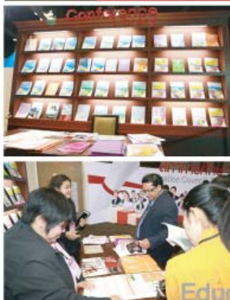
สภาการศึกษา Education Council Zone

โซน ๖ "สภาการศึกษา"(Education Council Zone) โซนนี้ทำให้ได้รู้จักองค์กรของสภาการศึกษามากขึ้น ทั้งหน้าที่ บทบาท รวมถึงได้ทราบว่า มีท่านใดบ้างเป็นกรรมการสภาการศึกษา โดยสามารถศึกษาได้จากนิทรรศการที่สำนักงานเลขาธิการสภาการศึกษาจัดไว้ อย่างสวยงาม ที่สำคัญในโซนนี้ ยังได้รวบรวมผลงานด้านนโยบาย งานวิจัย และองค์ความรู้ของสำนักงานเลขาธิการสภาการศึกษามาแสดงไว้อย่างน่าสนใจ