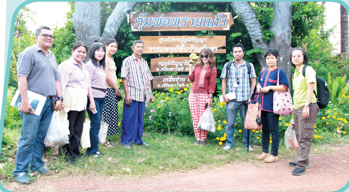
ปรึกษาปัญหาสุขภาพได้ ๑๖๕ หมู่ ๖ ทวีหัว อ.ศรีมหาโพธิ จ.ปราจีนบุรี ๒๕๑๔๐ โทร. ๐๘๙ ๐๑๕ ๗๔๘๘