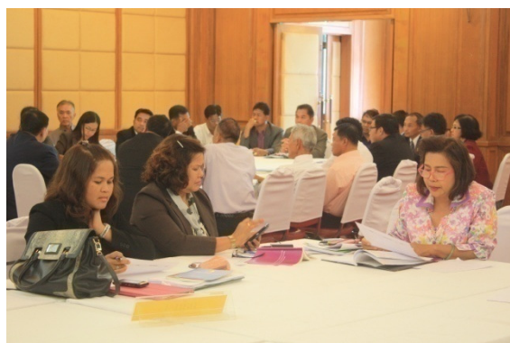
๑๑ ที่ประชุมกลุ่มสรุปเนื้อหาสาระและประเด็นข้อเสนอแนะ ดังนี้

กลุ่มที่ ๔ ประชุมระดมความคิดเห็นในประเด็นกฎหมายเกี่ยวกับการประเมินคุณภาพการศึกษา ผู้เข้าร่วมประชุมกลุ่มประกอบด้วย ผู้บริหารเขตพื้นที่การศึกษา ผู้บริหารสถานศึกษา คณะกรรมการสถานศึกษา ผู้นำท้องถิ่น องค์กรเอกชน ครู ศึกษานิเทศก์ และบุคลากรทางการศึกษา รวมทั้งผู้เกี่ยวข้องกับการศึกษา โดยมีวิทยากรประจำกลุ่มคือ ผู้แทนสำนักงานศึกษาธิการภาค