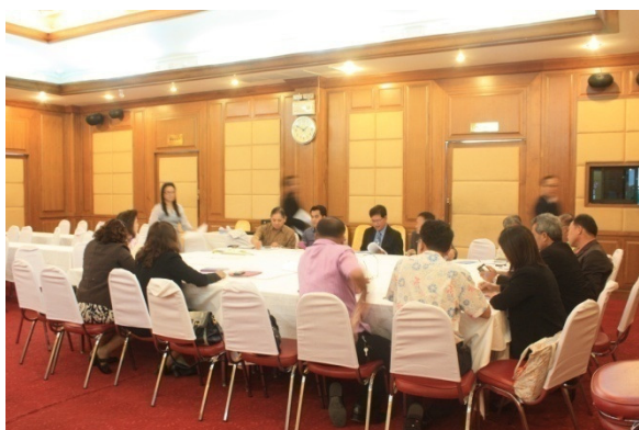
ประชุมกลุ่มสรุปเนื้อหาสาระและประเด็นข้อเสนอแนะ ดังนี้