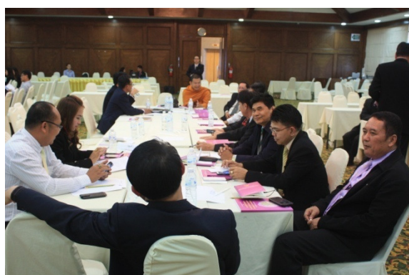
สำนักงานเขตพื้นที่การศึกษา ที่ประชุมกลุ่มสรุปเนื้อหาสาระและประเด็นข้อเสนอ ดังนี้