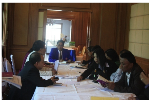
สรุปเนื้อหาสาระและประเด็นข้อเสนอแนะ ดังนี้

กลุ่มที่ ๕ ประชุมระดมความคิดในประเด็นการปรับแก้หลักสูตรการเรียนการสอน ผู้เข้าร่วมประชุมประกอบด้วย ผู้บริหารเขตพื้นที่การศึกษา ผู้บริหารสถานศึกษา คณะกรรมการสถานศึกษา ผู้นำท้องถิ่น องค์กรเอกชน ครู คณาจารย์ นิติกร และบุคลากรทางการศึกษา รวมทั้งผู้เกี่ยวข้องกับการศึกษา โดยมีวิทยากรประจำกลุ่มคือ ผู้แทนผู้บริหารสถานศึกษา ที่ประชุมกลุ่ม