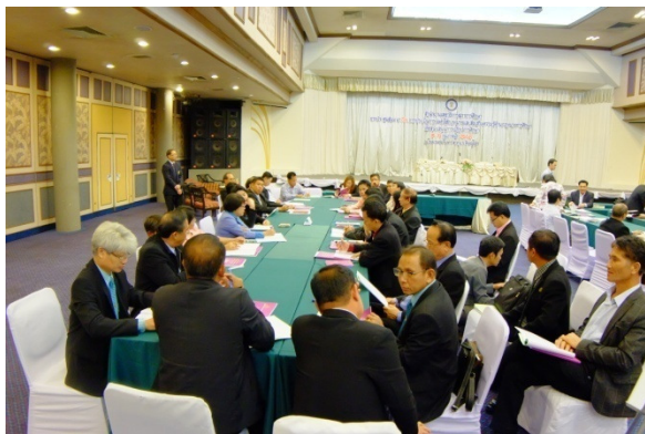
สำนักงานเขตพื้นที่การศึกษา ที่ประชุมกลุ่มสรุปเนื้อหาสาระและประเด็นข้อเสนอแนะ ดังนี้