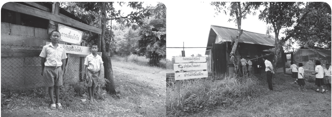
นักเรียนมีส่วนร่วมในการอธิบายกับผู้เข้ามาศึกษาดูงาน

ในศูนย์ควรมีสื่อที่หลากหลาย และมีของจริงประกอบด้วย เนื้อหาที่น่าเสนอตรงกับความ ต้องการ นอกจากนี้ศูนย์การเรียนรู้ให้ครอบคลุมเรื่องการสหกรณ์เรื่องการตลาดนอกเหนือจากการ เพาะปลูกและเลี้ยงสัตว์ เป็นกิจกรรมที่คนมาดูแล้วกลับไปปฏิบัติได้จริง ให้นำประเด็นที่เกี่ยวข้องกับ สุขภาพอนามัยมาใส่ไว้ในศูนย์ เพื่อให้ทุกคนเห็นความเชื่อมโยงว่ากิจกรรมในโครงการตาม พระราชดำริทุกอย่างจะนำไปสู่ผลลัพธ์ด้านสุขภาพรวมทั้งควรพิจารณานำสิ่งที่เป็นนวัตกรรมใหม่ๆ มาสอนคนในชุมชนด้วย แต่ก็ไม่ควรมองข้ามภูมิปัญญาท้องถิ่น