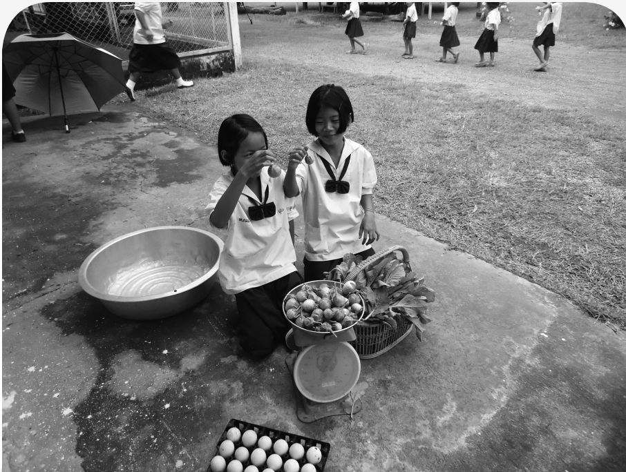
วิชาการงานฯ วิทยาศาสตร์ คณิตศาสตร์ ภาษา รวมอยู่ในกิจกรรมนี้

นักเรียนมีความคิดสร้างสรรค์และวิจารณ์ญาณโดยสะท้อนให้เห็นได้จากการสนทนากับกลุ่มนักเรียนที่ทีมถอดบทเรียนได้ตั้งคำถามท้าทายความคิดเกี่ยวกับการทำงานในโครงการส่งเสริมสหกรณ์และโครงการเกษตรเพื่ออาหารกลางวัน ซึ่งนักเรียนสามารถตอบได้อย่างคล่องแคล่ว เช่น