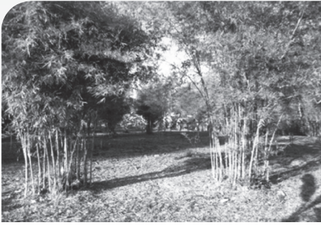
หน่อไม้สำหรับอาหารกลางวัน ใบไผ่สำหรับการปรับปรุงดินให้สมบูรณ์