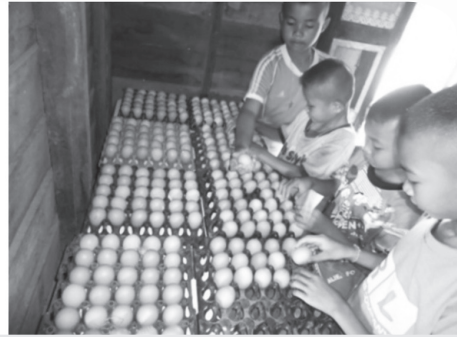
ผลผลิตจากความรับผิดชอบในการดูแลแม่ไก่อย่างดี

นักเรียนรู้จักการมองภาพรวม ตามปกตินักเรียนทั่วไปจะได้เรียนรู้สิ่งต่างๆ ในลักษณะที่แยกออกจากกัน ในบางโรงเรียนนักเรียนอาจจะได้เรียนรู้และได้ปฏิบัติในเรื่องการปลูกผักบ้าง แต่สำหรับโรงเรียนนี้จะใช้หลักปรัชญาของเศรษฐกิจพอเพียงเป็นฐานคิดแล้วนำกิจกรรมต่างๆ มาทำต่อเนื่องกัน ทำให้นักเรียนเห็นความเป็นจริงของชีวิตที่ว่าสรรพสิ่งต่างๆ มีความสัมพันธ์ซึ่งกันและกัน ซึ่งเป็นการสร้างให้นักเรียนมีความสามารถในการแก้ปัญหาและมีคุณลักษณะของการอยู่อย่างพอเพียง