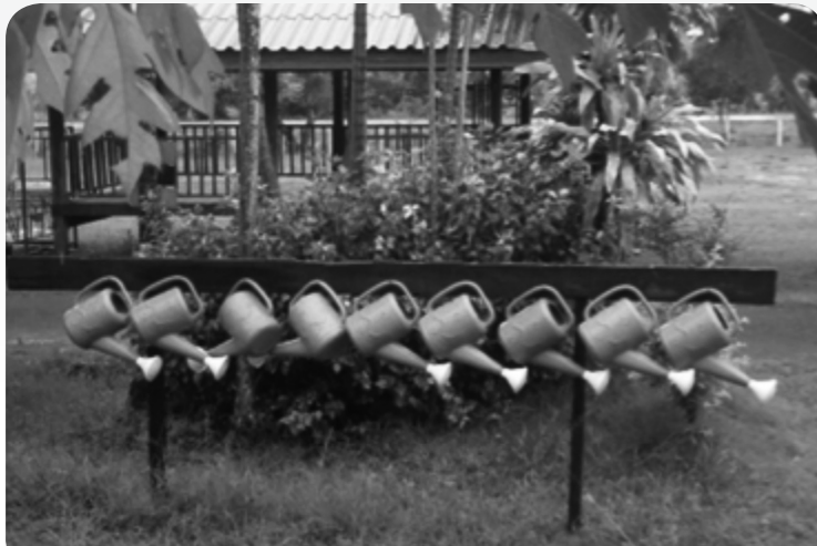
การสอนเรื่องความเป็นระเบียบและการมีวินัยนอกห้องเรียน

โรงเรียน” ผู้อำนวยการก็ได้ยืนยันว่า “เมื่อก่อนนี้โรงเรียนนี้เป็นอันดับท้ายๆ ของอำเภอ แต่ตอนนี้ อยู่ต้นๆ” เป็นผลทำให้จำนวนนักเรียนเพิ่มขึ้น และผู้ใหญ่บ้านที่เป็นกรรมการสถานศึกษา ๒ แห่งในตำบลเสริมว่า “ลองดูสิถ้าหากว่ามีรถรับส่งนักเรียน ผู้ปกครองเขาบอกว่าสิบกว่ากิโลก็จะมาเรียน” โรงเรียนสามารถดูแลนักเรียนเรื่องอาหารกลางวันได้อย่างมีประสิทธิภาพ แม้จะได้รับงบประมาณสนับสนุนจากรัฐไม่เพียงพอโดยการดำเนินงานโครงการเกษตรเพื่ออาหารกลางวัน ดังที่ผู้เข้าร่วมประชุมได้เล่าให้ฟังว่า