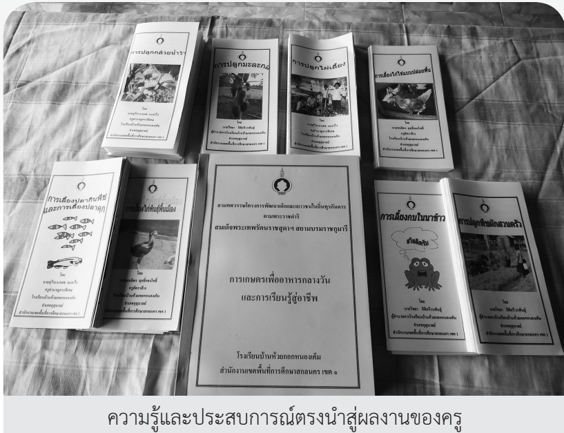
ความรู้และประสบการณ์ตรงนำสู่ผลงานของคุณ

สอนคือ ครูที่รับผิดชอบโครงการได้จัดทำเอกสารแนะนำวิธีการเพาะปลูกและเลี้ยงสัตว์ไว้หลายเล่ม ในค่านำเอกสารเรื่อง การปลูกพืชผักสวนครัว ผู้เขียนอธิบายว่า