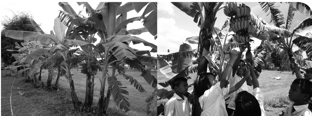
ที่โรงเรียนปลูกกล้วยจนเด็กได้กินกล้วยกันทุกคน

“สมัยก่อน แม่ครัวของโรงเรียนต้องไปซื้อเนื้อ ผัก และผลไม้จากตลาดมาทำให้นักเรียนกิน เดียวนี้เด็กมีอาหารกินพอเพียง ช่วยลดรายจ่ายได้ เมื่อก่อนนี้ไม่ค่อยพอกิน มีเด็ก ๓ คน มีกล้วย ๒ ลูก ต้องเป่า-ยิง-อุบ กันว่าใครจะได้กิน ครูเขาเก่ง ปลูกกล้วยจนเด็กได้กินทุกคน” (ผู้แทนชุมชน)