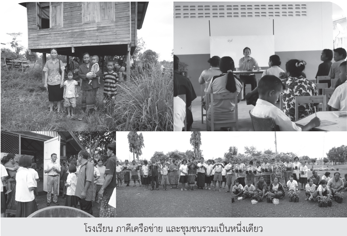
โรงเรียน ภาศิเครื่องช่าย และชุมชนรวมเป็นหนึ่งเดียว

คนในหมู่บ้านที่เป็นเขตบริการของโรงเรียนมีความรู้สึกเชิงบวกต่อโรงเรียน เนื่องจากเห็นได้ชัดเจนว่าโรงเรียนตั้งใจสอนลูกหลานของตนเองให้มีความรู้ในทางวิชาการ มีทักษะชีวิตที่เหมาะสมกับสภาพท้องถิ่น มีผลการสอบระดับชาติดี คนในชุมชนไม่มีทัศนคติเชิงลบว่าเขาส่งลูกหลานมาเรียนหนังสือ ไม่ใช่ให้มาขุดดิน เลี้ยงสัตว์ หากแต่เห็นด้วยกับวิธีการสอนนักเรียน ความสัมพันธ์แบบมิตรจิตมิตรใจนี้เห็นได้จากที่เจ้าหน้าที่จากกรมปศุสัตว์ยกตัวอย่างให้ฟังว่า “โรงเรียนแบ่งสัตว์เลี้ยงให้ชาวบ้านไปเลี้ยงที่บ้าน ชาวบ้านก็นำพันธุ์พืชดีๆมาให้โรงเรียน เป็นการแลกเปลี่ยนกัน”