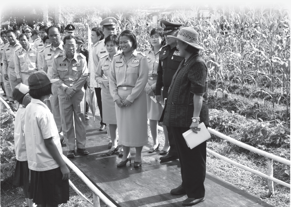
ที่สุดของความภาคภูมิใจในผลงานของทุกฝ่าย

โรงเรียนเป็นสถานที่ที่ชุมชนภาคภูมิใจ “โรงเรียนเรามีอะไรค่อนข้างครบถ้วน มีผู้มาดูงานของโรงเรียนเป็นประจำ มีทั้งส่วนราชการ ทั้งนักศึกษาจากวิทยาลัยที่ศิษย์เก่าไปเรียนอยู่ที่นั่น พามา นักเรียนจากโรงเรียนอื่นๆ ก็มาดูกัน สนใจว่าทำไมมีมะละกอ กล้วย ปลูก ฯลฯ เยอะแยะ” (ผู้ปกครอง)