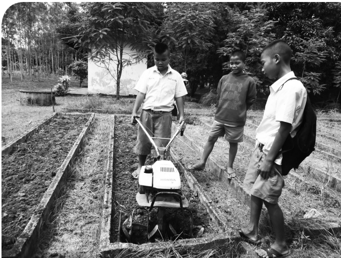
นักเรียนได้เรียนรู้ทั้งทฤษฎีและปฏิบัติ ในโครงการเกษตรเพื่ออาหารกลางวัน

เมื่อโรงเรียนรับปรัชญาของเศรษฐกิจพอเพียงเข้ามาดำเนินการในโรงเรียนตามข้อกำหนดของหลักสูตรแกนกลางการศึกษาขั้นพื้นฐาน พ.ศ. ๒๕๕๑ ชุมชนก็ได้รับรู้มาจากหน่วยงานราชการอื่นๆ เช่นกัน เช่น กรมการพัฒนาชุมชน กรมส่งเสริมการเกษตร เป็นต้น ผู้เข้าร่วมสนทนาได้เล่าให้ฟังว่า “ทุกคนในชุมชนรู้ว่าปรัชญาของเศรษฐกิจพอเพียงเป็นพระราชดำริของในหลวง ท่านสอนให้ปลูกพืชหลากหลาย ปลูกพืชแซมเพื่อการบริโภค ต้องรักษาลังแวดล้อม ในอดีตบริเวณนี้แห้งแล้งมาก แต่ปัจจุบันมีน้ำเพียงพอทั้งบ่อบาดาลและคลอง” (ผู้นำชุมชน) ที่ประชุมเห็นพ้องต้องกันว่าถึงแม้ว่าปรัชญาของเศรษฐกิจพอเพียงจะเข้ามาสู่ชุมชนได้หลายทาง แต่โรงเรียนถ่ายทอดให้แก่ชุมชนได้มากกว่าหน่วยงานอื่นๆ เนื่องจาก “มีการส่งผ่านนักเรียนไปสู่ผู้ปกครอง กรรมการสถานศึกษา และผู้นำชุมชน” (ผู้ปกครอง)