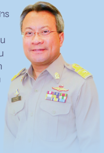
ดร.กมล รอดคล้าย เลขาธิการสภาการศึกษา