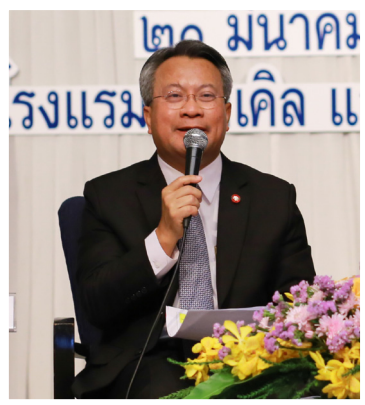
ดร.กมล รอดคล้าย เลขาธิการสภาการศึกษา

สำนักงานเลขาธิการสภาการศึกษา ได้เปิดตัวร่างกรอบทิศทางแผนการศึกษาแห่งชาติ พ.ศ. 2560 - 2574 โดยร่างกรอบทิศทางแผนการศึกษาแห่งชาติฉบับนี้ จะเป็นเสมือนหนึ่งแผนที่นำทางให้ระบบการศึกษาไทยสามารถพัฒนาศักยภาพและขีดความสามารถของทุนมนุษย์ให้เต็มตามศักยภาพสำหรับประชากรทุกช่วงวัย ตั้งแต่เกิดจนตลอดชีวิตสามารถแสวงหาความรู้และเรียนรู้ได้ด้วยตนเองอย่างต่อเนื่อง