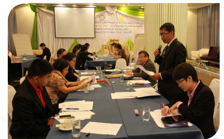
จ.อุดรธานี