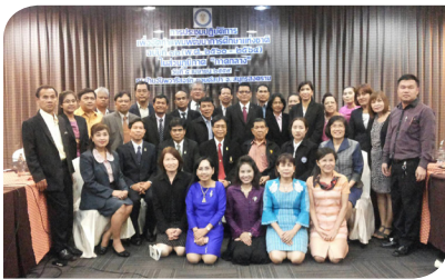
จ.สมุทรสงคราม