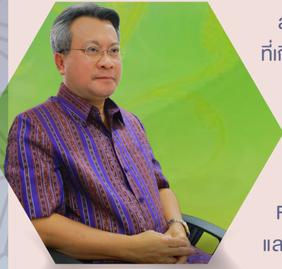
ดร.กมล รอดคล้าย เลขาธิการสภาการศึกษา

สวัสดีครับ พบกันเป็นครั้งที่ 7 สำหรับ OEC Newsletter ช่องทางใหม่ในการเผยแพร่ข่าวสารต่างๆ ที่เกี่ยวข้องกับแวดวงทางการศึกษา