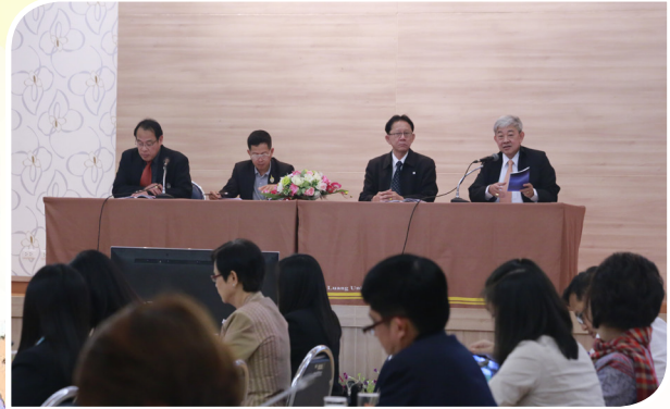
จ. เชียงราย