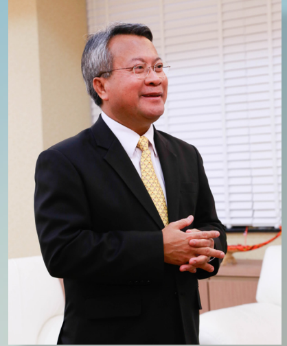
ดร.กมล รอดคล้าย เลขาธิการสภาการศึกษา

ด้านความร่วมมือกับนานาชาติ สกศ. ได้เข้าร่วมประชุมหารือด้านการศึกษากับประเทศรัสเซีย เกี่ยวกับการจัดการเรียนการสอนและการพัฒนาเด็กที่มีความสามารถพิเศษ เพื่อนำมาประยุกต์ให้เหมาะสมกับประเทศไทย เรื่องยุทธศาสตร์การผลิตและพัฒนาครู 15 ปี ขณะนี้ สกศ. ได้ลงพื้นที่เพื่อรับฟังความคิดเห็นใน 4 ภูมิภาค สำหรับผลการประชุมจะนำมาวิเคราะห์ สังเคราะห์เพื่อปรับแผนปฏิบัติการฯ ให้สมบูรณ์ยิ่งขึ้น ก่อนนำเสนอรัฐมนตรีว่าการกระทรวงศึกษาธิการต่อไป พบกันใหม่ฉบับหน้าครับ