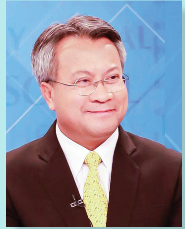
ดร.กมล รอดคล้าย เลขาธิการสภาการศึกษา