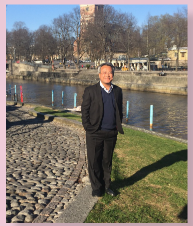
ดร.กมล รอดคล้าย เลขาธิการสภาการศึกษา