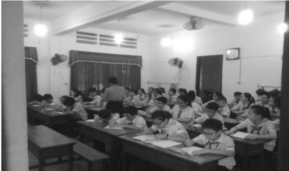
นักเรียนมัธยมศึกษาตอนต้น เล วัน เทียม เตรียมพร้อมเรียนทันทีที่เข้าห้องเรียน