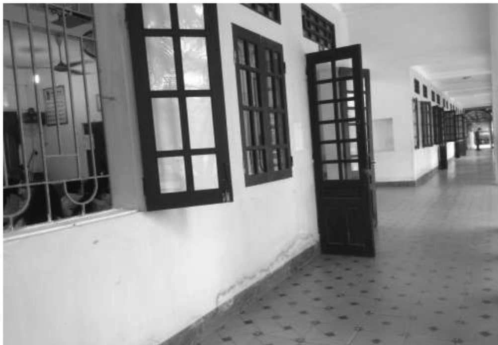
ประตูเข้า-ออกในห้องเรียนจะมีประตูเดียว