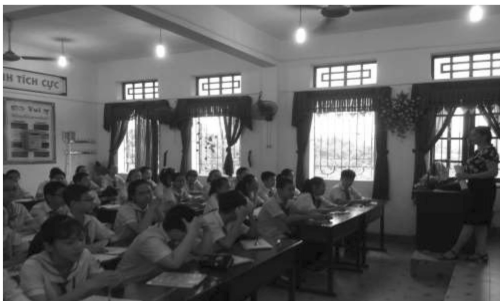
หน้าชั้นเรียนจะยกพื้นสูงเพื่อให้ครูมองเห็นนักเรียนชัดเจน