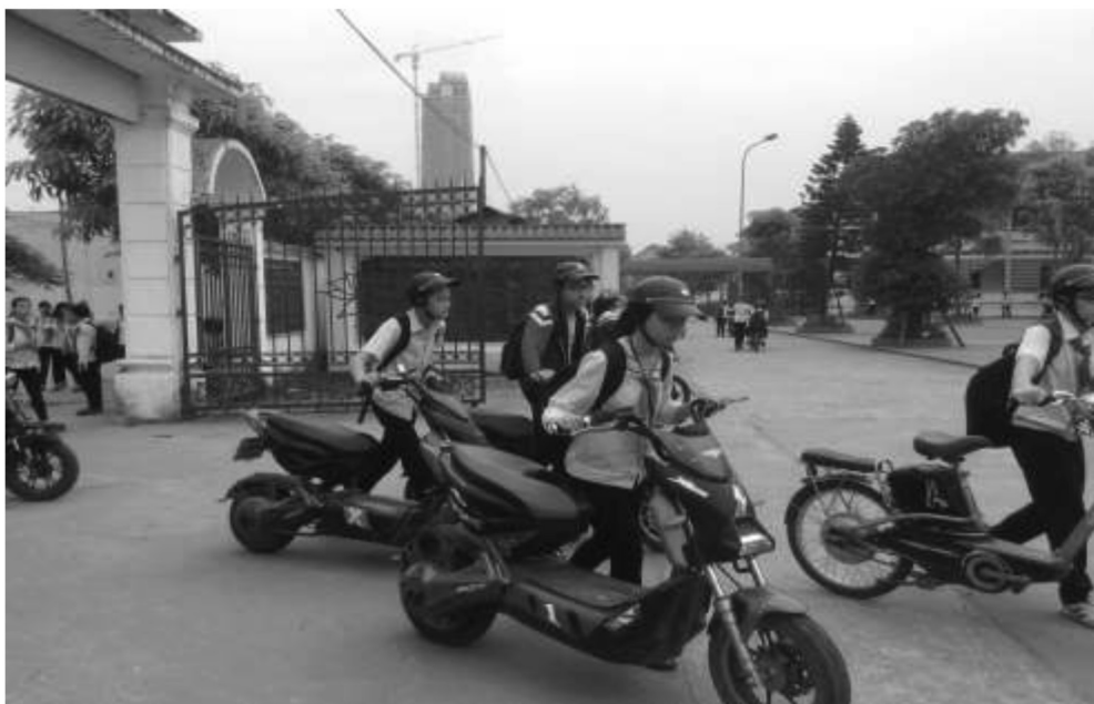
นักเรียนต้องจูงรถทุกชนิดภายในบริเวณโรงเรียน