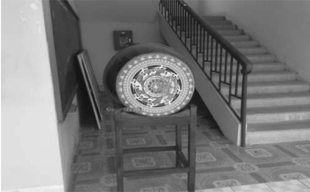
โรงเรียนที่เวียดนามจะใช้สัญญาณกลองแทนกริ่ง