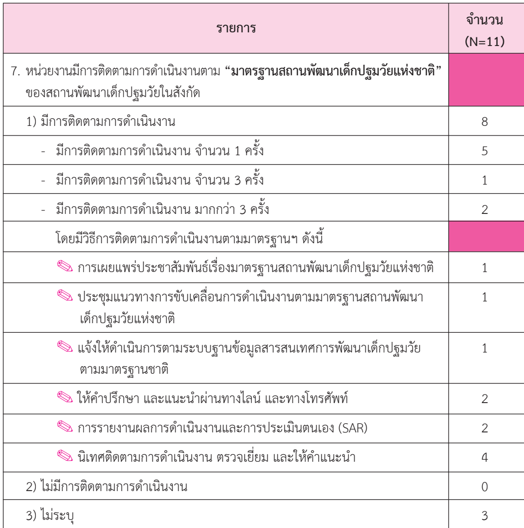
ตาราง 2 จำนวนการจัดการอบรม การจัดประชุม และการใช้มาตรฐานสถานพัฒนาเด็กปฐมวัยแห่งชาติ (ต่อ)