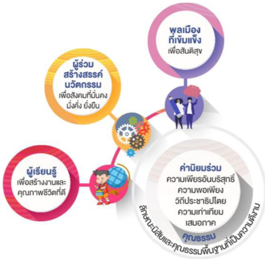
ที่มา : มาตรฐานการศึกษาของชาติ พ.ศ. ๒๕๖๑

กรอบผลลัพธ์ที่พึงประสงค์ตามมาตรฐานการศึกษาของชาติ พ.ศ. ๒๕๖๑