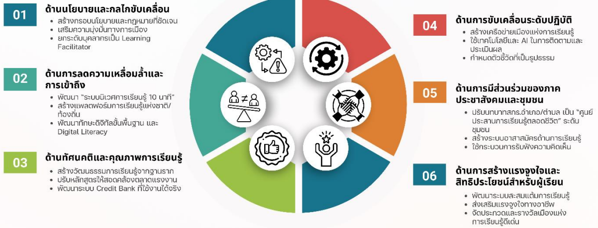
ภาพที่ 2 ข้อเสนอในการพัฒนาการเรียนรู้ตลอดชีวิตของประเทศไทย